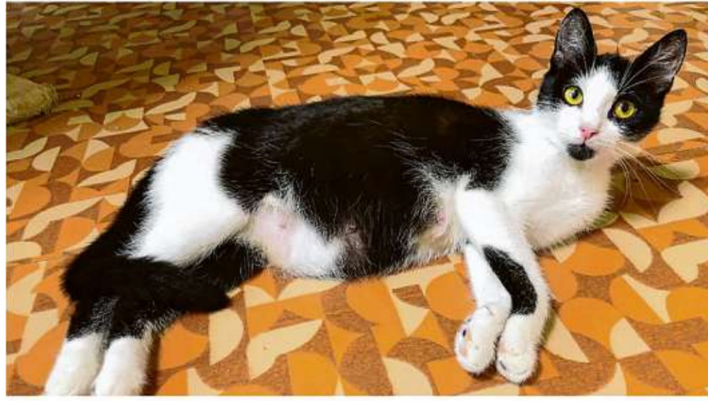
Die junge Kätzin Paulinchen lebt derzeit beim Frankfurter Tierschutzverein.